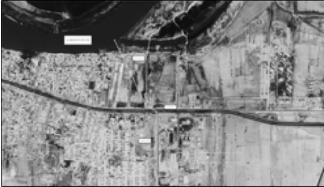
إتخذ خط أنابيب المياه إلى منشأة الزرقان