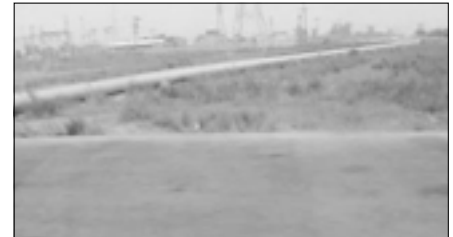
أحد الانابيب التي طمره بعد نشر تقرير "السياسة"