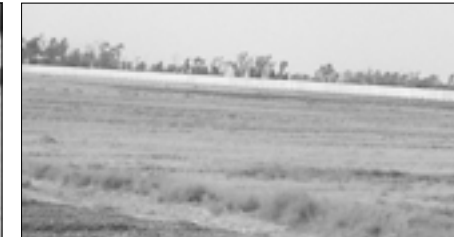
السور الشيد حول المنشأة النووية