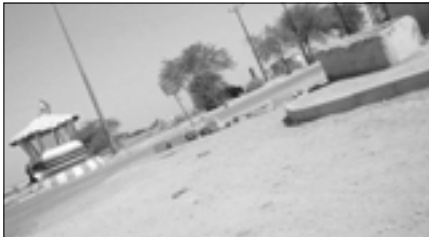
القمة مراكز دراسة جديدة في محيط المنشأة بعد تقرير الصحفية

"السياسة" خاص، تواصلت إرتدادات الموضوع الذي أثارته "السياسة" في عددها الصادر الثلاثاء الفائت وللتعلق باستحداث إيران منشآت سريّة في منطقة الزرقان لأغراض نووية، فبعد الرد الذي أصدرته السفارة الإيرانية في الكويت على الخبر، ونشر "السياسة" لهذا الرد إيماناً منها بحرية الرأي، حتى وإن تضمن الرد لغة فيها من التوريع أكثر مما تحمل التوضيح، ثلثت "السياسة" رداً على "الجمعية الوطنية لدولة عربستان" و"المنظمة الإسلامية السنية الاحوازية" و"الحزب الديمقراطي الاحوازي" و"هيئة المركز الاحوازي لحقوق الانسان" وليس بعيداً عن التأكيدات التي أوردتها "السياسة" الثلاثاء الفائت يسير تقدير مفصل لتلقه "السياسة" من تحالف اتفاقية الـ 14 الاحوازية" رداً على بيان السفارة الإيرانية الى ان رد السفارة أكد خبر وجود المنشأة النووية أكثر مما يفهم، وهو إذ ادعى "فكرة الخبر المنشور في "السياسة" الا انه في الرد نفسه اعترف ان صور الموقع المنشورة هي بالفعل في منطقة الزرقان ولم يدرك انه بذلك يؤكد صحتها.